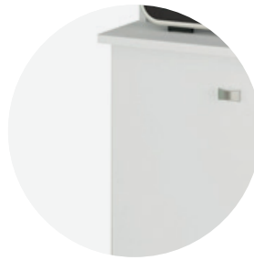
Madera de densidad media MDP